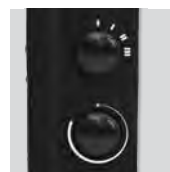
Termostato automático regulable y selector de potencia

Ambos modelos se pueden instalar en la pared.