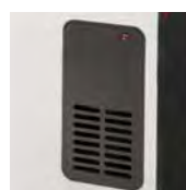
Salida de aire forzado TLS-503T